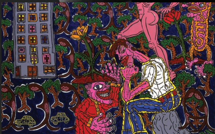
Robert COMBAS, Je pleure, je t'aime [détail], 1987, huile sur toile, 190 x 245 cm © Robert Combas