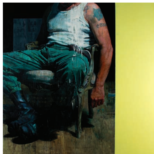
Jean FAUCHEUR , Autoportrait #1 , 1998, plâtre et tissu, 45 cm © Jean Faucheur | Christian LAPIE , Les parcelles lumineuses [détail], 2016, chêne traité à l'huile de lin sous vide, 600 x 250 x 200 cm © Christian Lapie | François BARD , Pour l'éternité , 2019, huile sur toile, 200 x 200 cm © François Bard