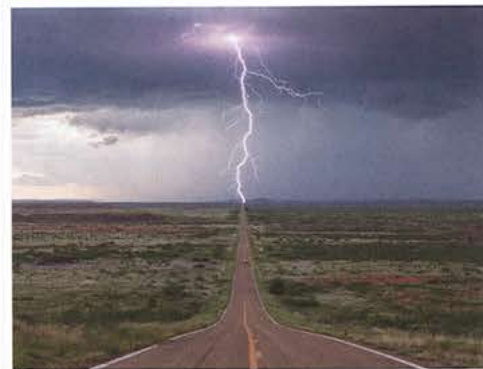
Basile Ducournau, L'orage parfait (Nouveau-Mexique), 2015

société, d'autant plus quand le thème qui lui est imposé est celui du paysage, ou « des paysages, pas si sages » pour être plus précis. L'occasion leur est alors donnée de retourner leur environnement sous tous les angles. Qu'il s'agisse des préoccupations écologiques, de l'impact de l'Homme, des catastrophes naturelles ou bien au contraire de la beauté et de la force incommensurable dont notre planète fait preuve, ce sont autant d'aspects qui nous sont donnés à voir. Le paysage n'est plus simplement une source d'émerveillement pour les artistes, le but n'est pas de le retranscrire ou de l'idéaliser, mais bien de le traduire avec lucidité, de l'interroger. À travers les œuvres d'une soixantaine d'artistes, dont Anselm Kiefer, Robert Combas ou encore Chaix, Jean-Pierre Attal, Christophe Dalecki, Joël Brisse, Basile Ducournau, Yoann Ximenes et Nurhidayat, venez admirer les paysages comme eux les voient.